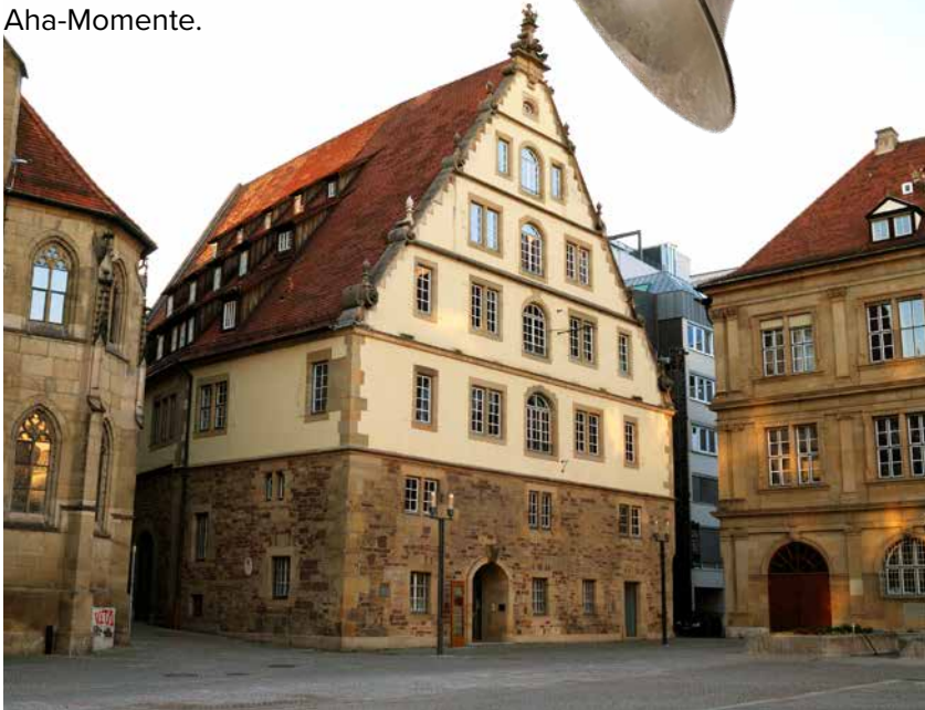
Haus der Musik im Fruchtkasten, Schillerplatz 1, 70173 Stuttgart

Wer Musik besser verstehen will, wird im Haus der Musik fündig. Zwischen kompakten Live-Demos und Mitmach-Stationen wird aus Zuhören Erleben. Nicht nur Musikfreunde bekommen hier handfeste Aha-Momente.