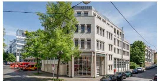
Feuerwache 2 West