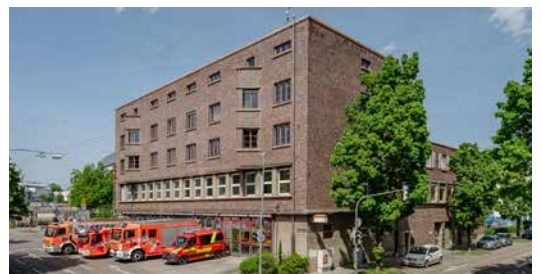
Feuerwache 4 Feuerbach