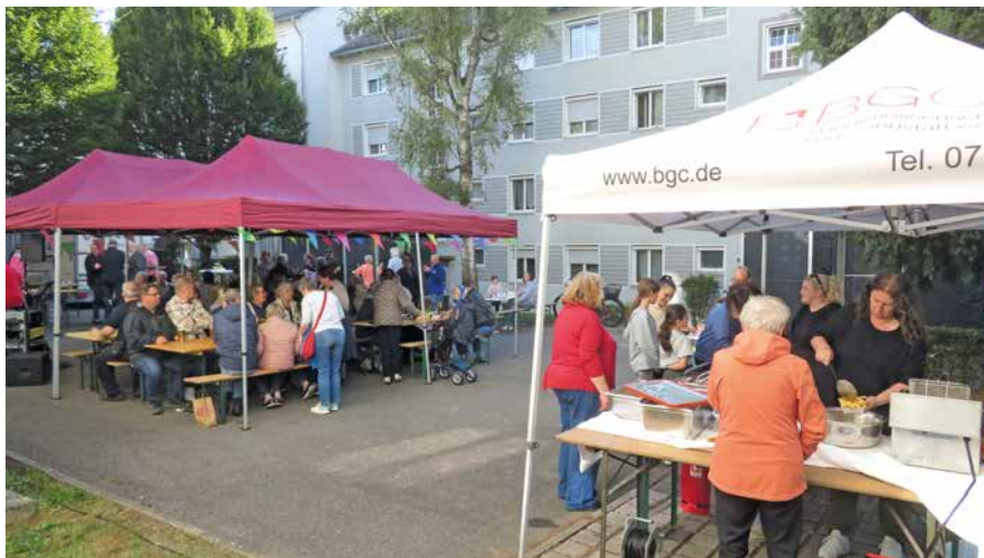
Gut besucht bei bester Stimmung