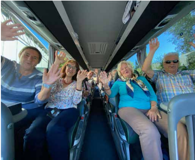
Unsere Reisegruppe vom 3. September ...

Es sind nicht immer die Metropolen und üblichen Tourismusziele, die einen Besuch wert sind. Nehmen wir zum Beispiel Pforzheim. Die Stadt gilt als Zentrum der deutschen Schmuck- und Uhrenindustrie und bietet auch sonst einige Sehenswürdigkeiten. Davon konnten sich die Teilnehmenden unserer beiden Leserreisen überzeugen, die diesen September in die „Goldstadt“ führten.