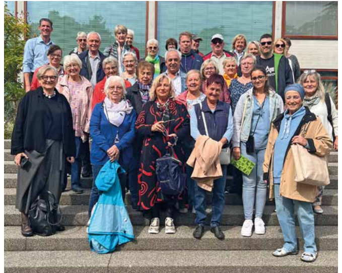
... und unsere Reisegruppe vom 10. September

Deshalb stand ein Besuch im weltweit einzigartigen Schmuckmuseum als Muss auf dem Programm. Rund 2.000 Exponate feinster Handwerkskunst aus fünf Jahrtausenden – von der Antike bis zur Gegenwart – konnten die WeitBlicker bewundern: kunstvoll und fein gearbeitete