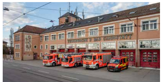
Feuerwache 3 Bad Cannstatt