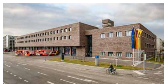
Feuerwache 5 Filder