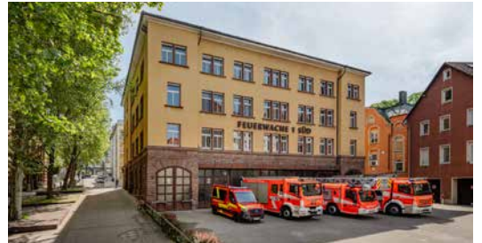
Feuerwache 1 Süd